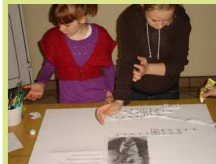
Przyklejamy zdania i rozwiązana krzyżówkę