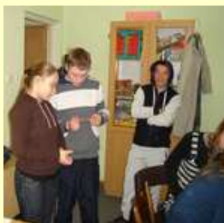
Kolejny punkt - w gabinecie psychologów