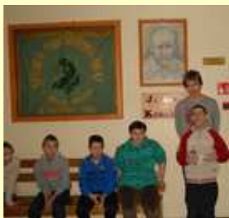
W oczekiwaniu na przybycie wszystkich uczestników gry pozujemy pod sztandarem