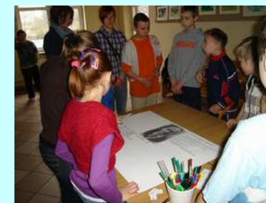
Portret już gotowy