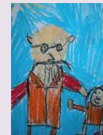
Karol Puchała kl. III