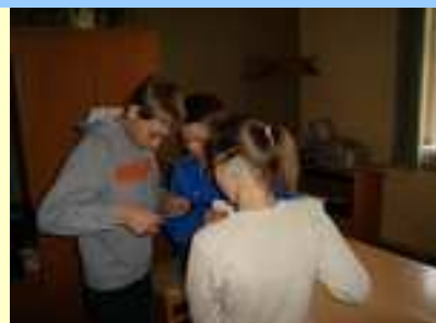
Gorączkowa narada - gdzie teraz powędrujemy ?