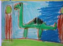
Karol Puchała kl. III