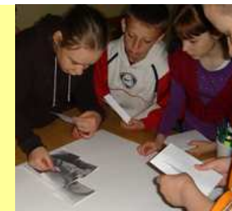
Kolejne zadanie to ułożenie portretu Janusza Korczaka