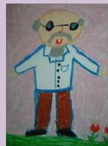
Krzyś Dąbrowski kl. III