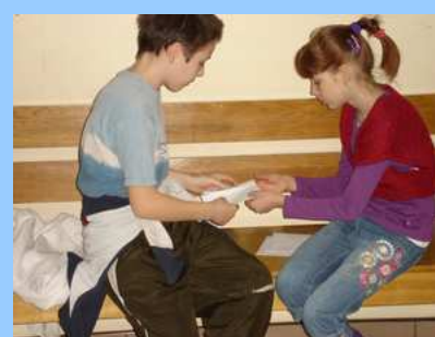
Układamy zdania z rozsypanki