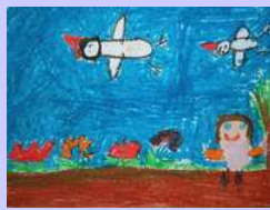
Krzysztof Dąbrowski kl. III