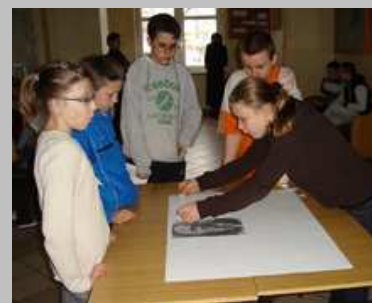
Dalej trudzimy się nad tym portretem