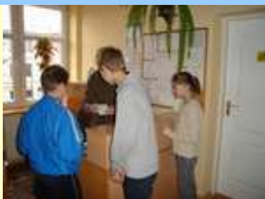
Pierwszy punkt gry