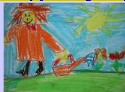
Karol Puchała kl. III